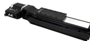
X series devices