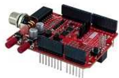
モデル : X-AS01

Arduino (CPU) + X シリーズ Shield (Zaber デバイス用インターフェースユニット)