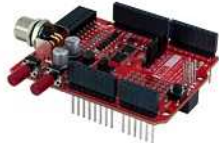
モデル : X-AS01