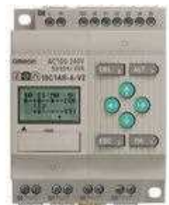
PLC (PI/O 又は DI/O)